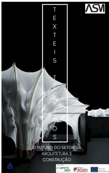
Atividade 9: Estudo - Os Têxteis Técnicos e o futuro da Construção e Arquitetura