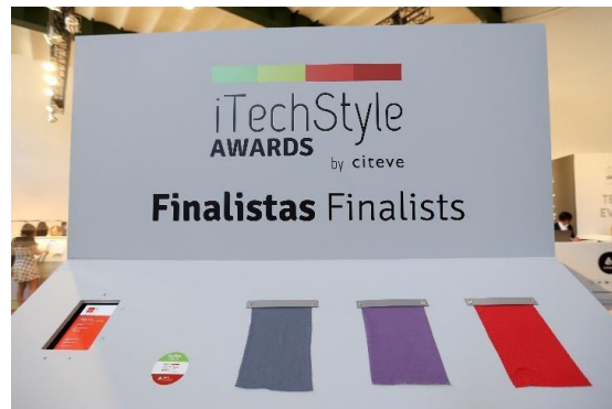
Atividade 2: FORUM I - i Tech Style