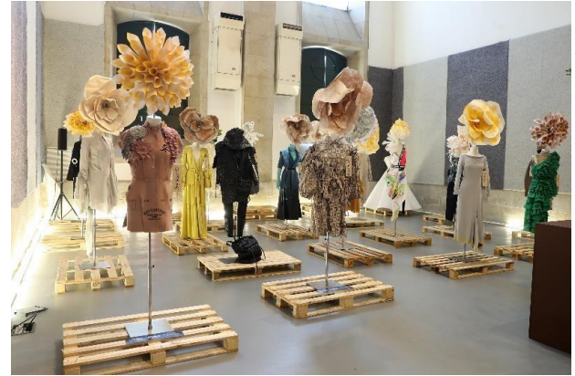
Atividade 6: FORUM III - Sustainable Production & Green Products (2ª edição)