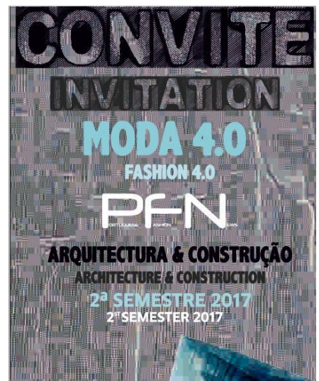
Atividade 10: FORUM V - Architecture & Construction