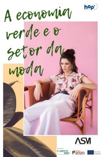
Atividade 5: Estudo - A Economia Verde e o Setor da Moda