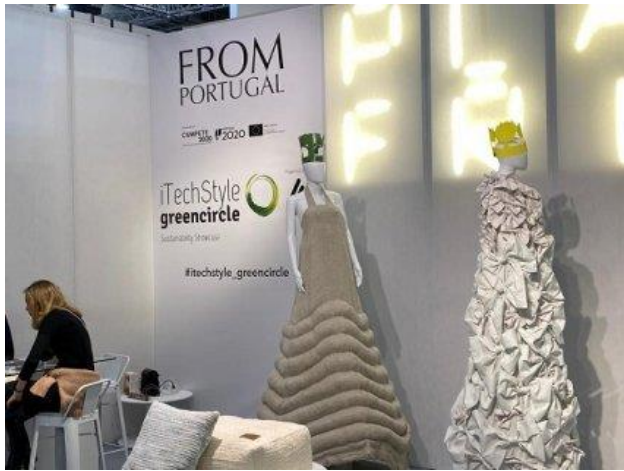
Fórum de Novos Talentos e Concurso Novos Criadores (Edição 2019)