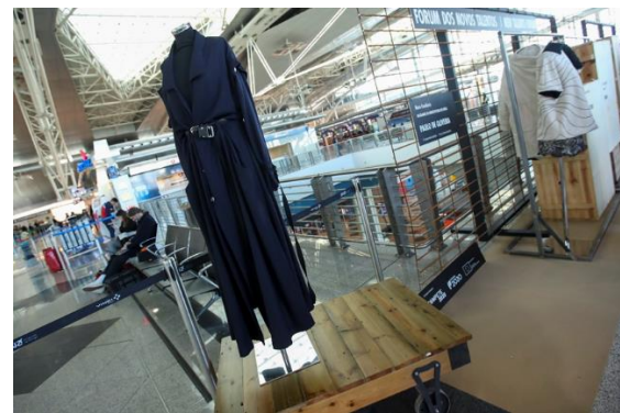
Fórum de Novos Talentos (3ª Edição - 2020)