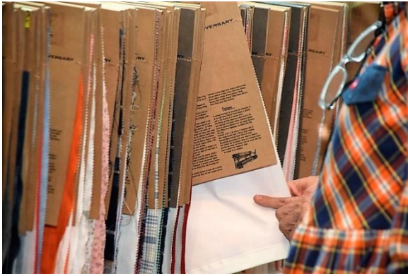
Fórum de Tendências – Tecidos (Edições 2019)