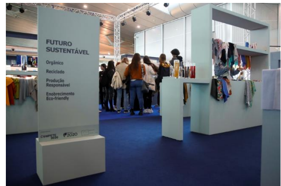
Fórum de Tendências – Tecidos (3ª Edição - 2020)