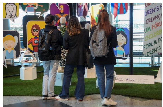
Fórum da Criança (3ª Edição - 2020)