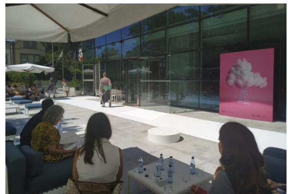
Inovação e Desfile (3ª Edição - 2020)