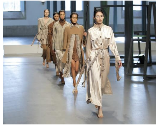
Inovação & Desfile 1ª Edição - 2019